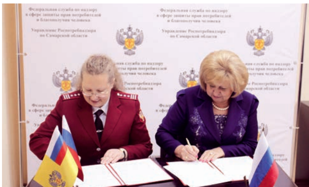
Подписано соглашение о взаимодействии и сотрудничестве с Управлением Роспотребнадзора по Самарской области.