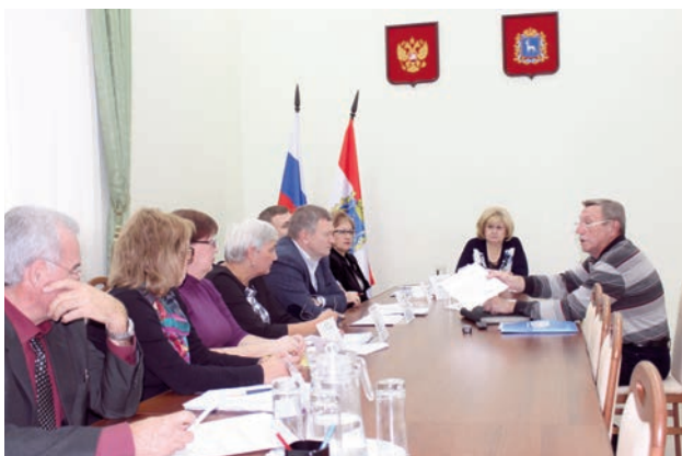
Состоялся целевой прием граждан, приуроченный к Международному Дню пожилых людей.