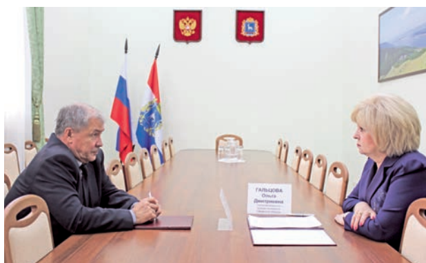
Подписано соглашение о взаимодействии и сотрудничестве с Территориальным органом Росздравнадзора по Самарской области.