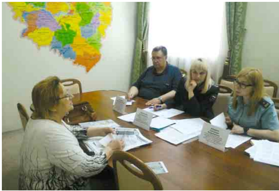
Заседание постоянно действующей рабочей группы по рассмотрению жалоб на действия или бездействие судебных приставов

по правам человека в Самарской области, количество жалоб на бездействие судебных приставов-исполнителей по взысканию алиментов невелико, каждая из них является криком души заявителя.