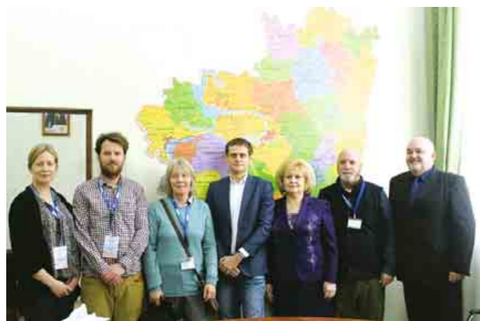
Рабочая встреча с международными наблюдателями Международной миссии по наблюдению Бюро по демократическим институтам и правам человека Организации по безопасности и сотрудничеству в Европе

необходимость создания временных избирательных участков для того, чтобы люди, работающие посменно, работающие в цехах с непрерывным циклом, имели возможность реализовать свое конституционное право и проголосовать на выборах Президента РФ.