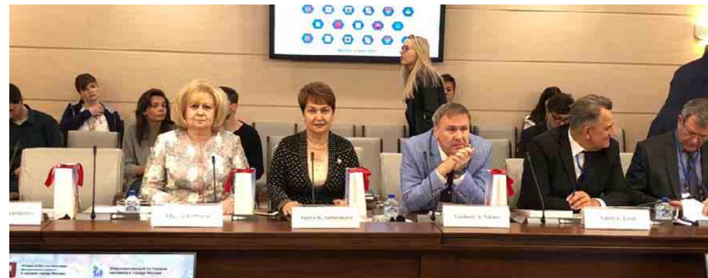
Круглый стол «Содействие разнообразию и созданию свободной от дискриминации среды в городах России, принимающих Чемпионат мира по футболу»

В круглом столе приняли участие Уполномоченный по правам человека в Российской Федерации Т.Н. Москалькова,