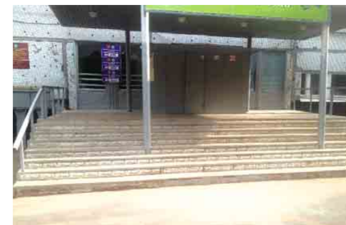
Неприспособленный вход в помещение избирательных участков №№ 2659, 2660 и 2661, располагающееся по адресу: г. Самара, ул. Георгия Димитрова, д. 50 (Школа № 157).

На 584 участках не решен вопрос по орга-