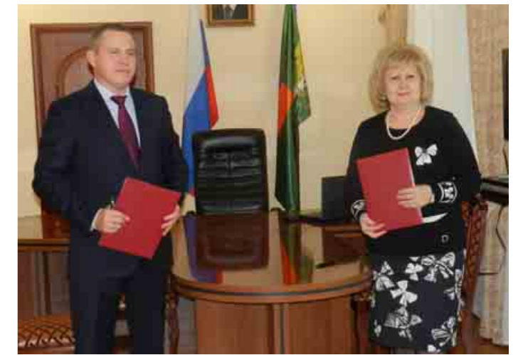
Соглашение с УФССП России по Самарской области о взаимодействии и сотрудничестве было подписано в 2015 году

Одной из форм взаимодействия является проведение сотрудниками аппарата Уполномоченного по правам человека в Самарской области совместно с руководством Управления Федеральной службы судебных приставов России