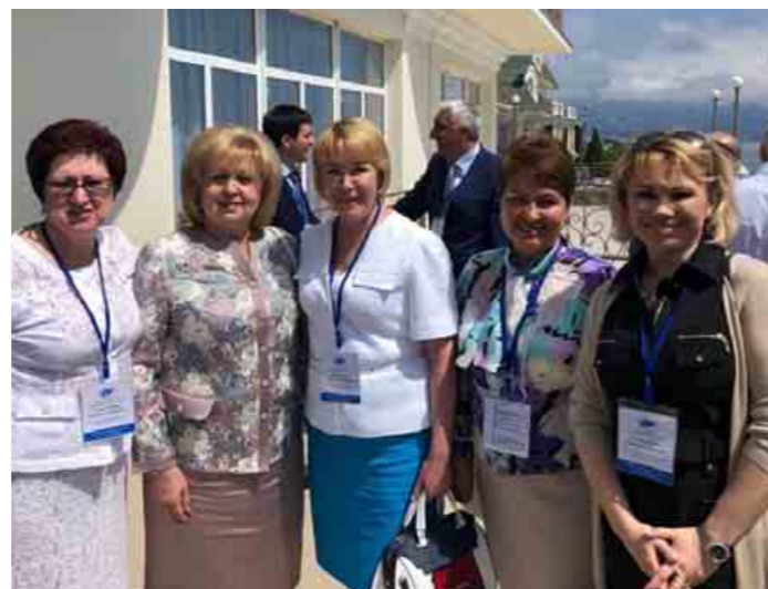
Региональные омбудсмены подняли острые вопросы реализации прав граждан, страдающих психическими заболеваниями

человека выступил и ответил на вопросы заместитель министра здравоохранения РФ О.О. Салагай. Омбудсмены пожаловались на отказ властей законодательно увеличить возраст до 18 лет для дачи согласия на госпитализацию, на закрытие центров трудовой адаптации для психоневрологических. О.О. Салагай обещал, что министерство вернется к обозначенным вопросам.