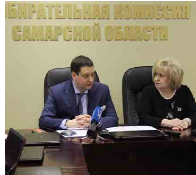
Посещение Избирательной комиссии Самарской области и ситуационного центра независимого наблюдения в день выборов Президента Российской Федерации 18 марта 2018 года

Например, избиратель заранее знает, что по состоянию своего здоровья не сможет ока-