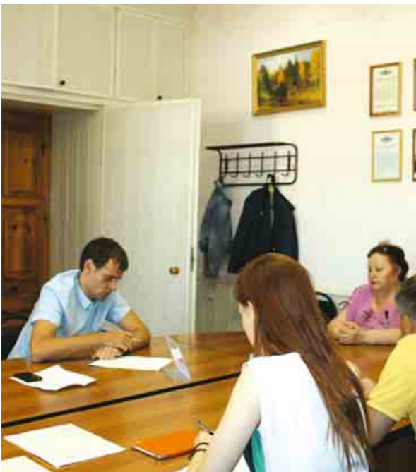
В сельском поселении Тимашево Кинель-Черкасского района состоялся выездной прием граждан