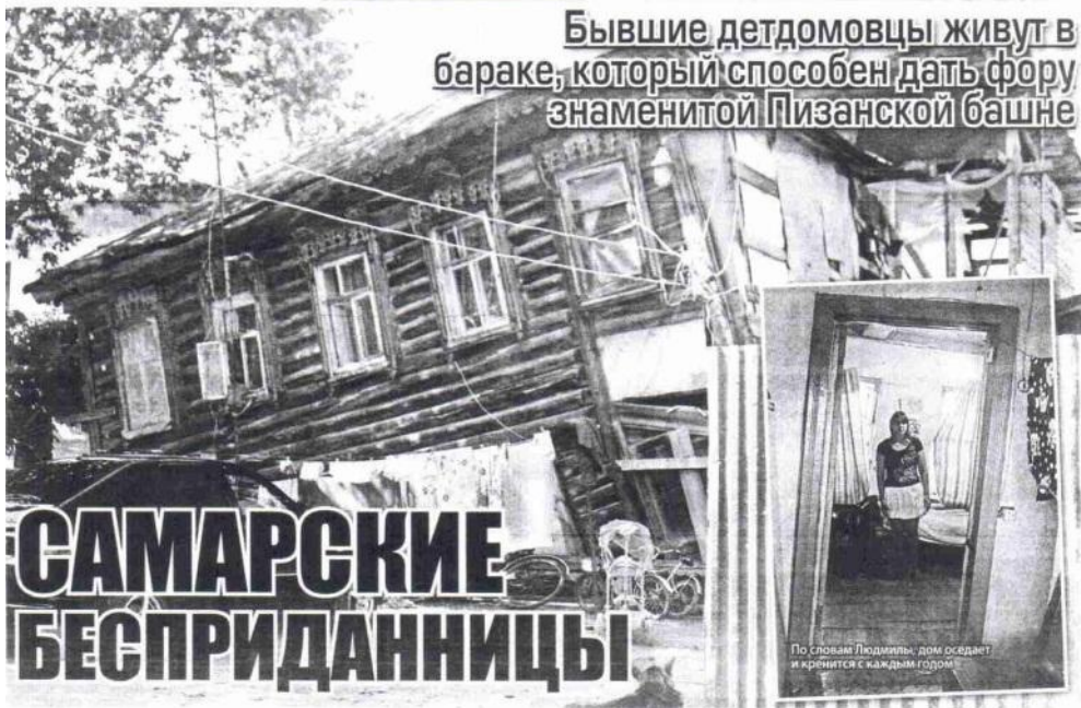
По словам Людмилы, дом оседает и кривится с каждым годом