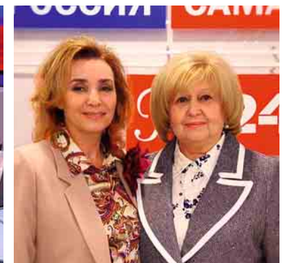
Телемарафон по соблюдению избирательных прав граждан в прямом эфире ГТРК «Самара»