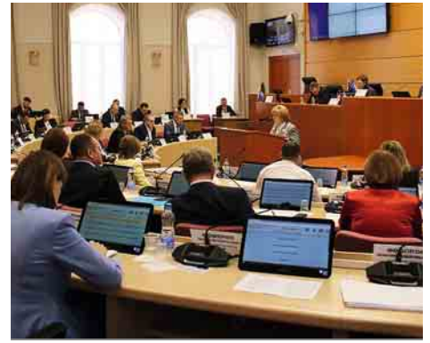
Ежегодный доклад Уполномоченного по правам человека представлен Губернатору Самарской области Д.И. Азарову, прокурору Самарской области С.П. Берижницкому, депутатам Самарской Губернской Думы