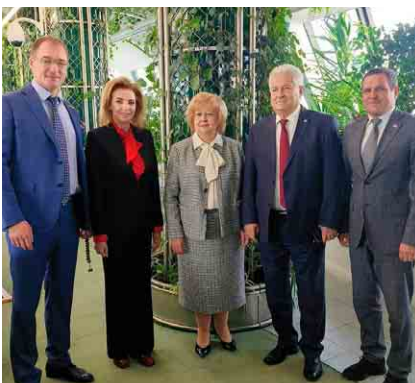
Взаимодействие с депутатским корпусом