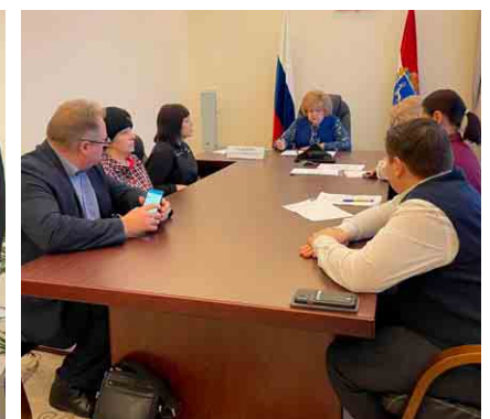
Проведение приемов граждан, коллегиальное принятие мер