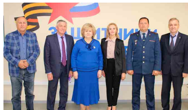
Подведение итогов первого года работы филиала Госфонда «Защитники Отечества»