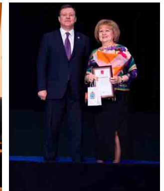
Вручение Благодарности Президента Российской Федерации В.В. Путина О.Д. Гальцовой