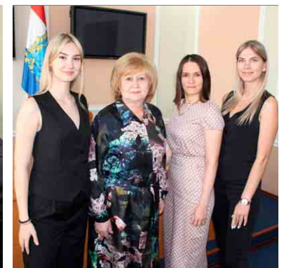
Участие Молодежного совета при Уполномоченном в правозащитной работе