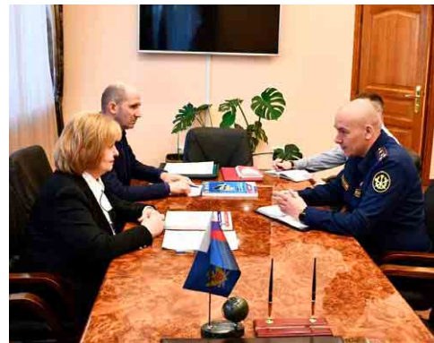
Совещание с начальником УФСИН России по Самарской области А.Н. Климовым