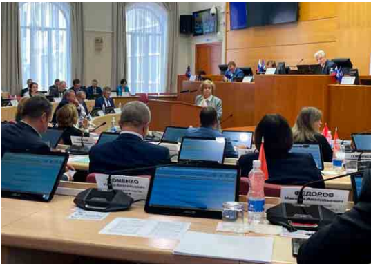
Представление доклада на пленарном заседании Самарской Губернской Думы