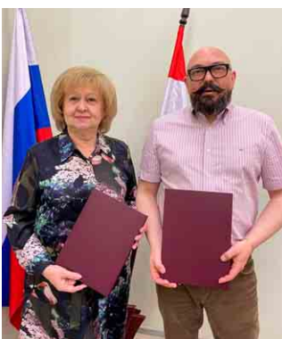
Подписание соглашения о сотрудничестве с Самарстатом