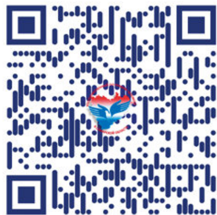
Федеральный закон от 29.09.2025 № 364-ФЗ «О внесении измене- ний в статьи 81 и 351-7 Трудово- го кодекса Российской Федерации»

В соответствии с изменениями в Трудовой кодекс РФ, в период приостановления действия трудового договора включается также период со дня, следующего за днем окончания прохождения работником военной службы по мобилизации или по контракту, заключенному в период мобилизации, военного положения или в военное время, либо со дня, следующего за днем окончания действия заключенного им контракта о добровольном содействии в выполнении задач, возложенных на Вооруженные Силы Российской Федерации или войска национальной гвардии Российской Федерации, до дня возобновления действия трудового договора, но не более 3-х месяцев.