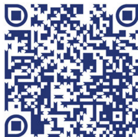
Федеральный закон от 15.10.2025 № 377-ФЗ «О внесении измене- ния в статью 108 Федерального закона «Об образовании в Рос- сийской Федерации»

Вступили в силу изменения в Федеральном законе «Об образовании в Российской Федерации» в части исключения периодов участия в СВО из периода времени, в течение которого действительны результаты олимпиад школьников.